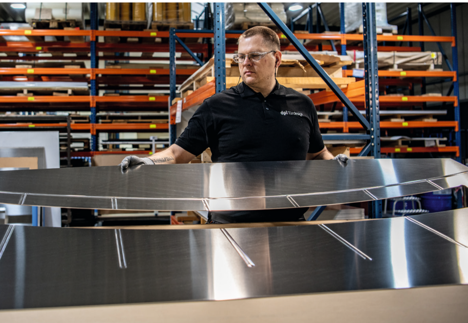
Unser neues CNC-Bearbeitungszentrum ermöglicht eine hochdynamische, präzise Bearbeitung unserer Werkstücke.

Moderne IT-Lösungen. Einfache Handhabung. Seite 8