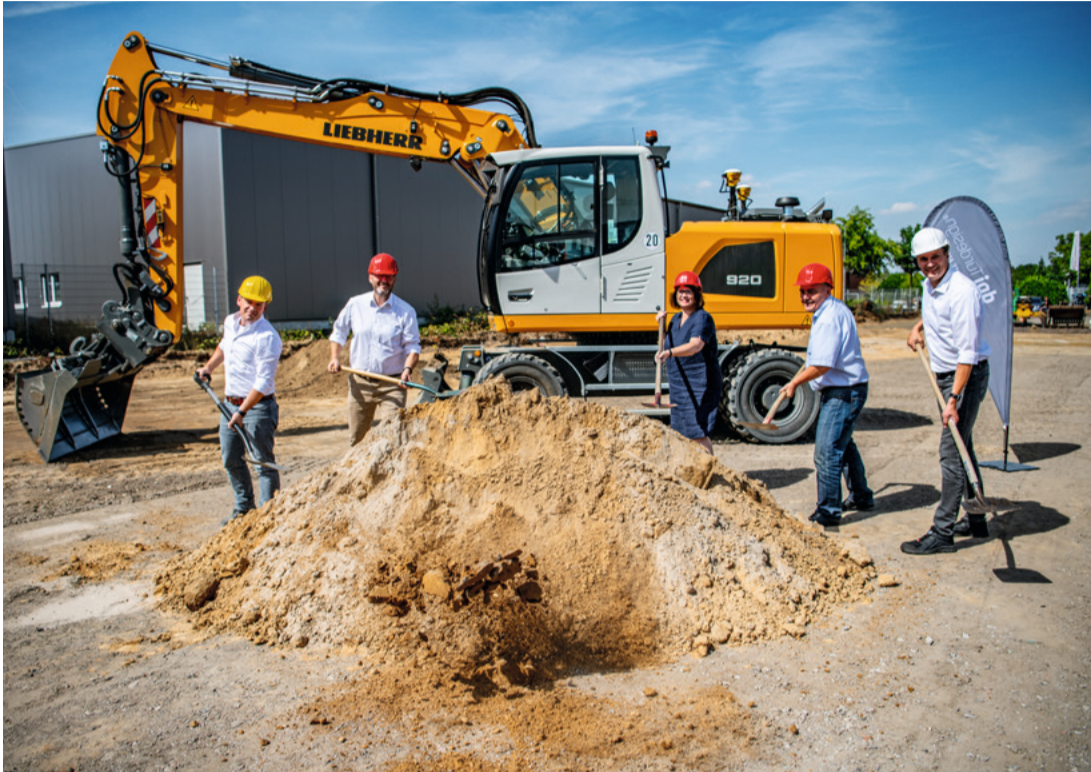
Der offizielle Spatenstich erfolgte am 23.08.2022 mit der Bürgermeisterin und dem Architektenteam.